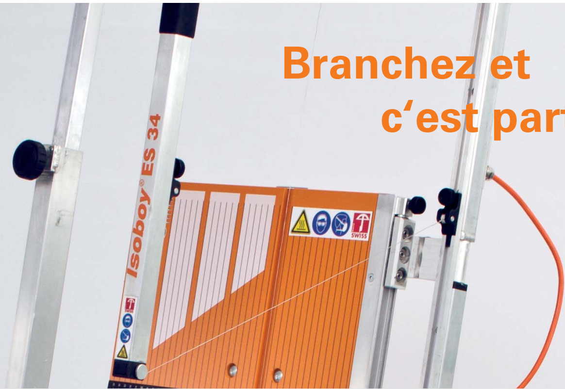
Découpeur d'angles Isoboy ES 34