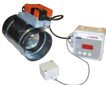
RR 125 M1 PAG