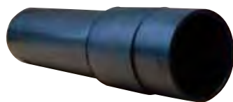
PUITS 300 MUR