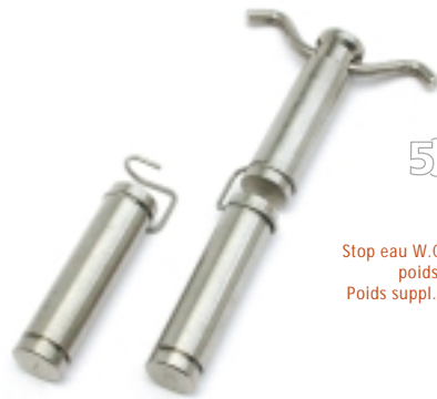
Stop eau W.C. (Réf. 78-1715) pour réservoir avec tirette centrale