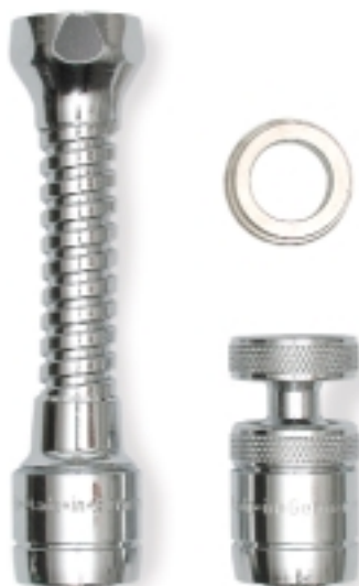
Economiseur LONG-SAVER, prolongé flexible