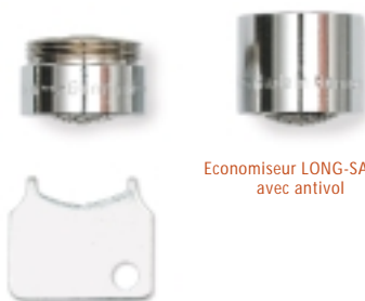
Economiseur LONG-SAVER avec antivol