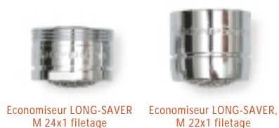
Economiseur LONG-SAVER M 24x1 filetage