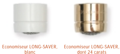
Economiseur LONG-SAVER, blanc